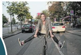
E-Bike Aktionstag am 9. März 2017

Pünktlich zum Beginn des Frühlings und damit auch der Fahrradsaison veranstaltet Zweirad Beilken auch in diesem Jahr am 9. März wieder einen E-Bike Aktionstag mit der Möglichkeit, sich über die neuesten Trends zu informieren und beraten zu lassen und Probefahrten zu unternehmen.