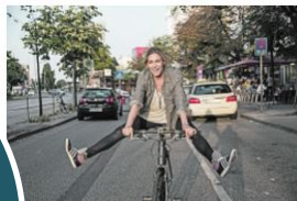
E-Bike Aktionstag am 9. März 2017

Pünktlich zum Beginn des Frühlings und damit auch der Fahrradsaison veranstaltet Zweirad Beilken auch in diesem Jahr am 9. März wieder einen E-Bike Aktionstag mit der Möglichkeit, sich über die neuesten Trends zu informieren und beraten zu lassen und Probefahrten zu unternehmen.