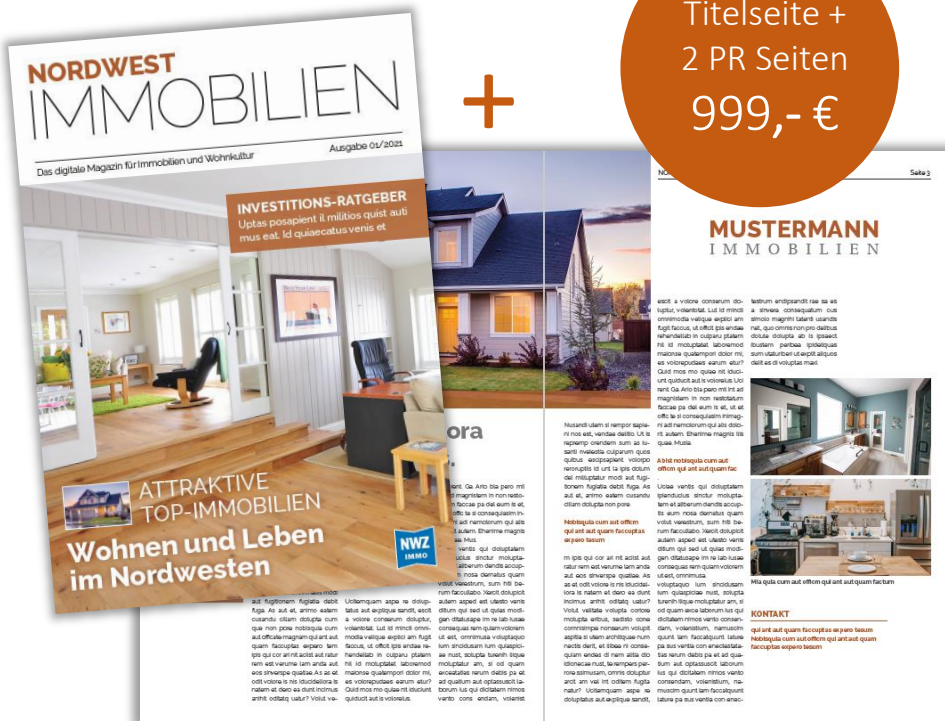
Musterseiten | Änderungen vorbehalten.