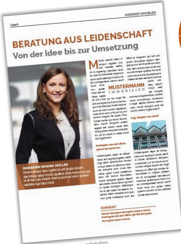
Musterseiten | Änderungen vorbehalten.